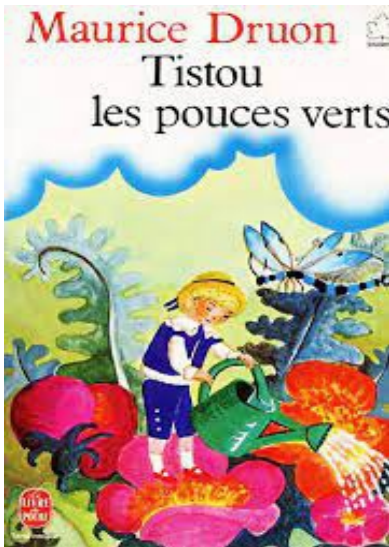
Quelques couvertures des