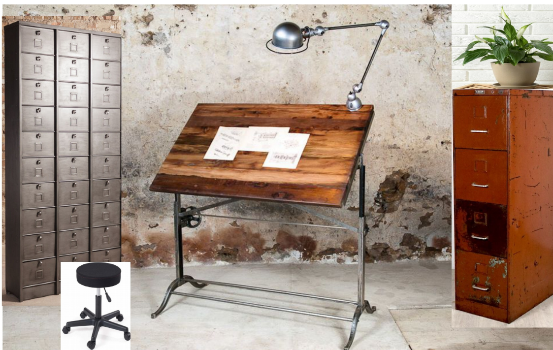
Une idée du décor : le bureau des architectes/narrateurs, adaptable aux lieux de l'histoire.

L'entièreté des personnages et des accessoires sera conçue à partir de papiers. Tistou sera représenté par une marionnette du même matériau ; les autres personnages seront évoqués par le biais de masques/sacs ou d'éléments caractéristiques, tels que des moustaches de kraft. Les fleurs et autres plantes que Tistou fait apparaître seront également réalisées dans ce matériau dans un souci de recyclage et d'écologie.