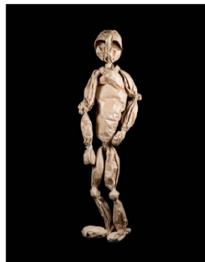
Une idée de la marionnette Tistou