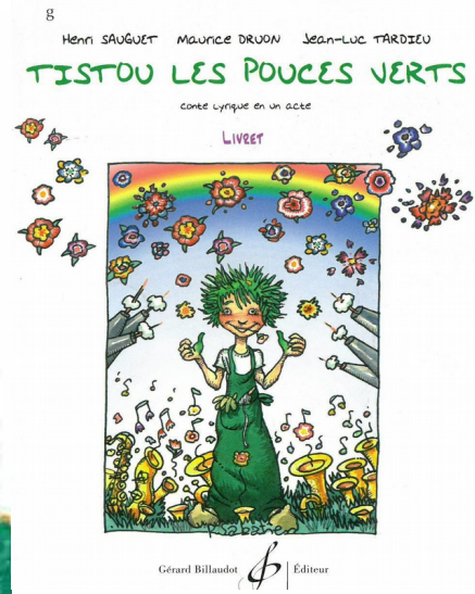
différentes éditions du livre depuis